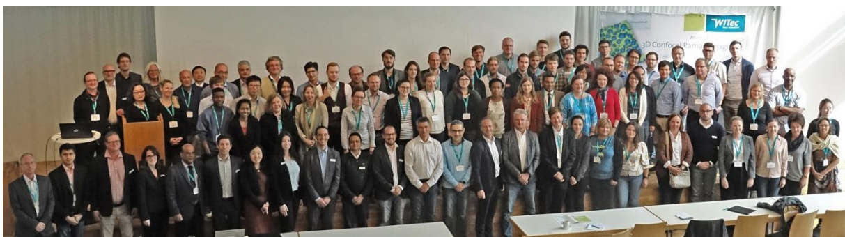
Die Teilnehmer des 16. Raman Imaging Symposiums im Auditorium des Ulmer Stadthauses.

www.witec.de/assets/Download/News/WITec-RamanSymposium2019-Lyman.jpg